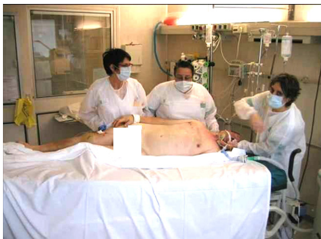
Figure 1 Les électrodes du cardioscope sont retirées de la face antérieure du thorax en laissant le monitoring de la pression artérielle et de la saturation en oxygène.

L'utilisation de coussins sous le thorax et le pelvis semble ne présenter aucun avantage pour le patient en termes