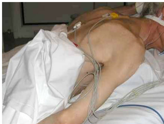
Figure 2 Coussin cunéiforme positionné sous le thorax du patient afin de limiter les pressions au niveau de la face et éviter l'hyperextension de la tête.

La tête est tournée sur le côté en veillant à la bonne perméabilité des voies aériennes et des cathéters. Elle peut être changée de côté en alternance toutes les trois heures afin de limiter les pressions sur la face et les lésions des muqueuses, sauf en cas d'impossibilité morphologique liée au patient ou technique liée au matériel en place.